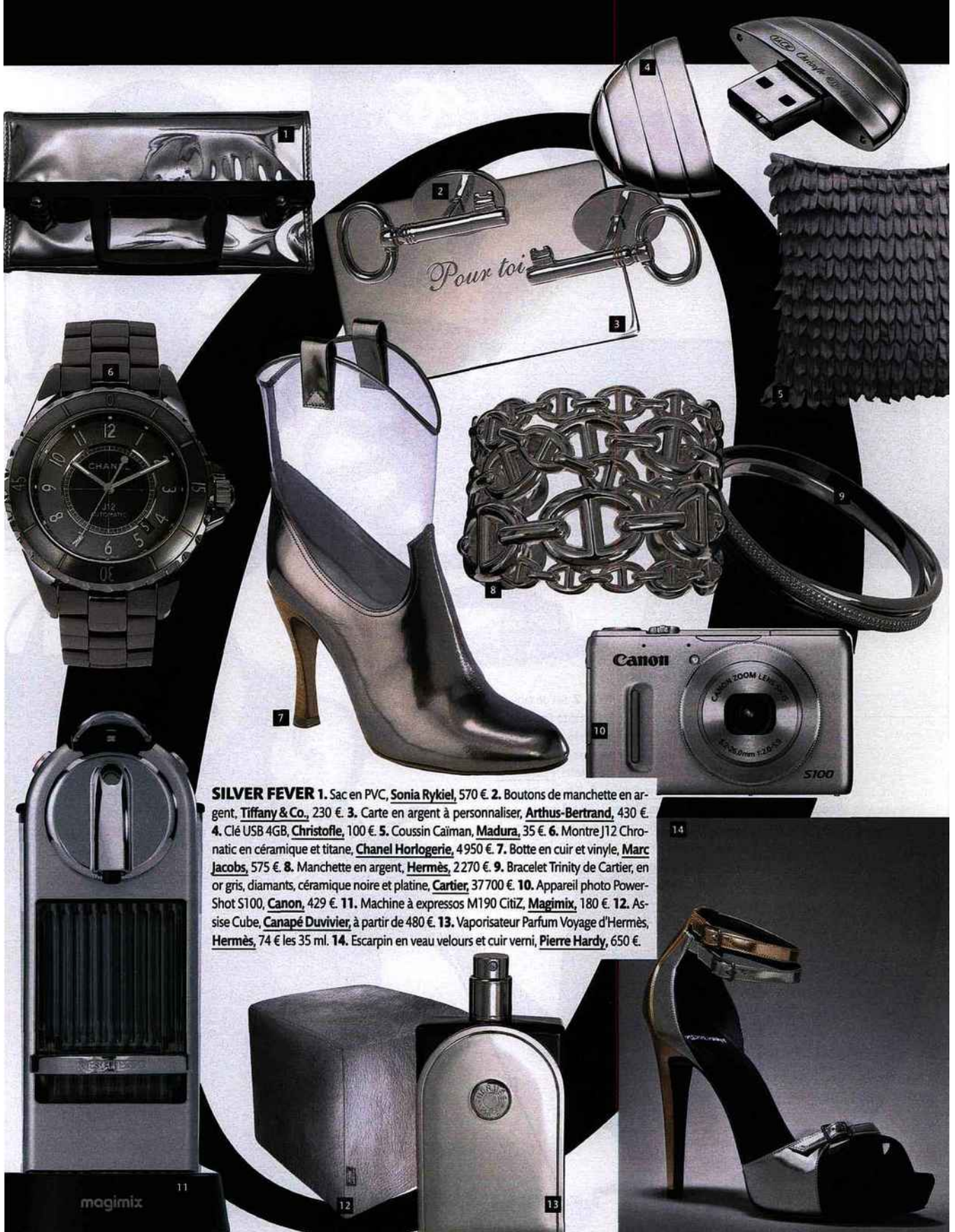
SILVER FEVER 1. Sac en PVC, Sonia Rykiel , 570 €. 2. Boutons de manchette en argent, Tiffany & Co. , 230 €. 3. Carte en argent à personnaliser, Arthus-Bertrand , 430 €. 4. Clé USB 4GB, Christofle , 100 €. 5. Coussin Caïman, Madura , 35 €. 6. Montre J12 Chronatic en céramique et titane, Chanel Horlogerie , 4950 €. 7. Botte en cuir et vinyle, Marc Jacobs , 575 €. 8. Manchette en argent, Hermès , 2270 €. 9. Bracelet Trinity de Cartier, en or gris, diamants, céramique noire et platine, Cartier , 37700 €. 10. Appareil photo PowerShot S100, Canon , 429 €. 11. Machine à expressos M190 Citiz, Magimix , 180 €. 12. Assise Cube, Canapé Duvivier , à partir de 480 €. 13. Vaporisateur Parfum Voyage d'Hermès, Hermès , 74 € les 35 ml. 14. Escarpin en veau velours et cuir verni, Pierre Hardy , 650 €.