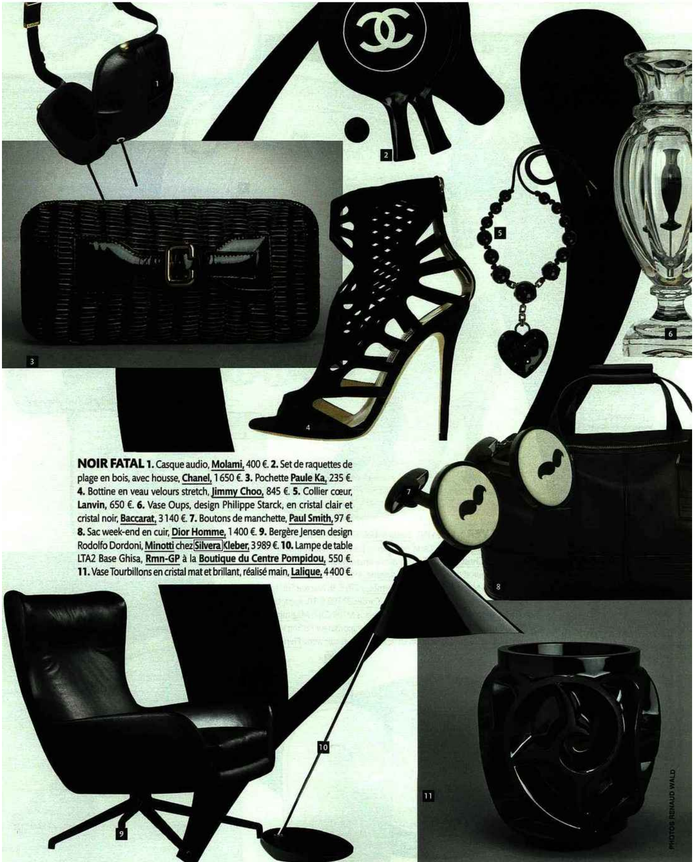
NOIR FATAL 1. Casque audio, Molami , 400 €. 2. Set de raquettes de plage en bois, avec housse, Chanel , 1 650 €. 3. Pochette Paule Ka , 235 €. 4. Bottine en veau velours stretch, Jimmy Choo , 845 €. 5. Collier cœur, Lanvin , 650 €. 6. Vase Oups, design Philippe Starck, en cristal clair et cristal noir, Baccarat , 3 140 €. 7. Boutons de manchette, Paul Smith , 97 €. 8. Sac week-end en cuir, Dior Homme , 1 400 €. 9. Bergère Jensen design Rodolfo Dordoni, Minotti chez Silvera|Kleber , 3 989 €. 10. Lampe de table LTA2 Base Ghisa, Rmn-GP à la Boutique du Centre Pompidou , 550 €. 11. Vase Tourbillons en cristal mat et brillant, réalisé main, Lalique , 4 400 €.