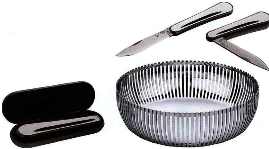
"Il carif", design Pierre Charpin pour Alessi.