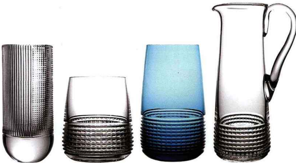
intervalle design Pierre Charpin Une collection en cristal taille pour Saint Louis