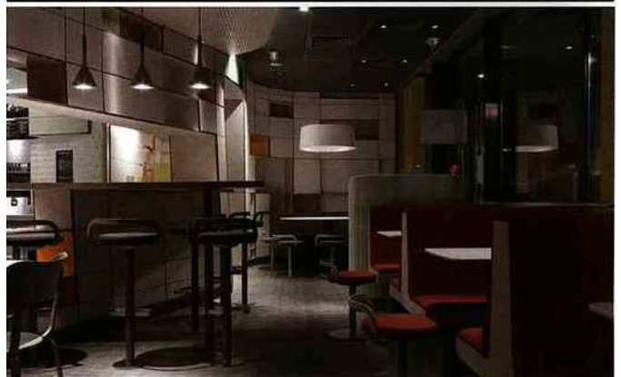
Le nouvel aménagement des fast-foods Mac Donald's par Patrick Norguet.