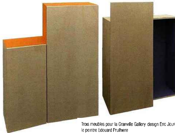
Trois meubles pour la Granville Gallery design Eric Jourdan en collaboration avec le peintre Edouard Prulhière