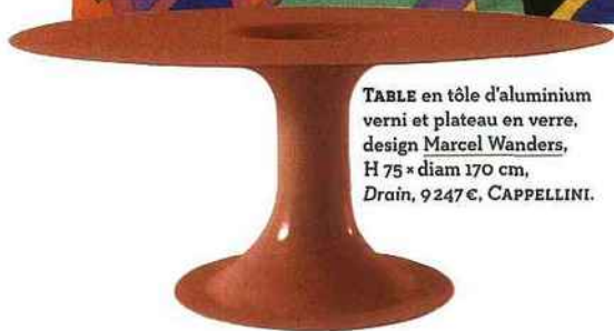
TABLE en tôle d'aluminium verni et plateau en verre, design Marcel Wanders, H 75 x diam 170 cm, Drain , 9 247 €, CAPPELLINI.

MEUBLE de rangement en bois contreplaqué peint signé Sanna Lindström, L 154 x H 94 cm, Sign , 1 300 €, KARL ANDERSSON & SONER.